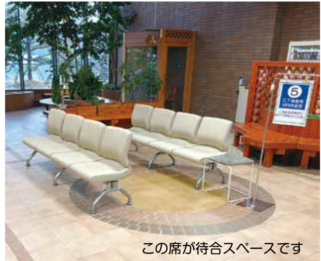
この席が待合スペースです