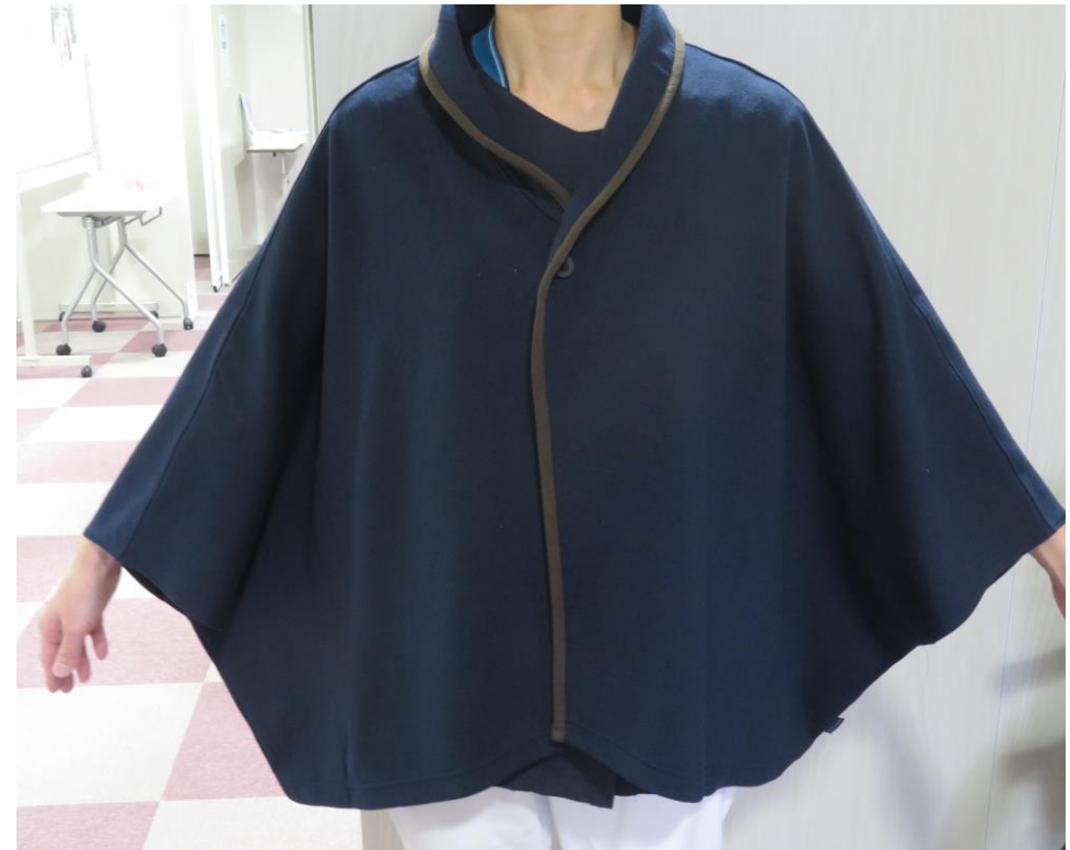
ポンチョフリーサイズ