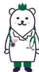
コウセイくん JA北海道厚生連 キャラクター

令和2年8月より、当院ホームページで人間ドックの空き状況の確認と予約申込ができるようになりました。トップページの「人間ドック空き状況確認と申込」をクリックしてください。画面をすすめていくと、空き状況の画面になり、性別を選択すると、それぞれの空き状況が、「○」、「△」、「×」でカレンダー内に表示され、希望日を入力できるようになっています。