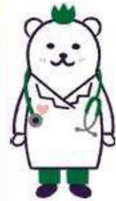
コウセイくん JA北海道厚生連 キャラクター

令和2年10月より、人間ドックオプション検診で「膵臓・胆のうドック」を開始いたしました。