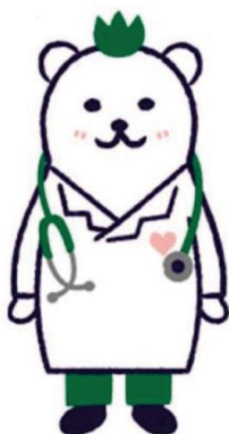
コウセイくん JA北海道厚生連キャラクター

※札幌厚生病院の胆膵専門医による診断体制となっています。 異常が発見された場合、札幌厚生病院での精密検査、治療が可能です