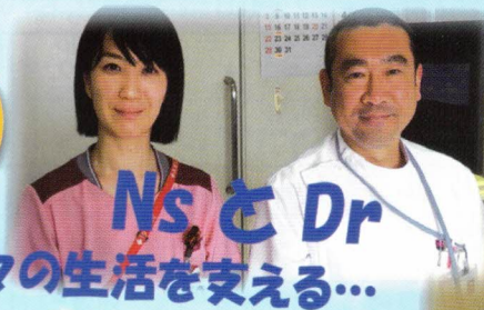
NsとDr 日々の生活を支える…