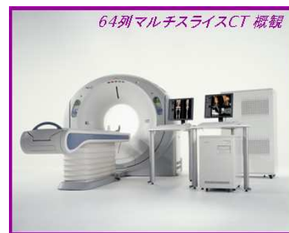
64列マルチスライスCT 概観