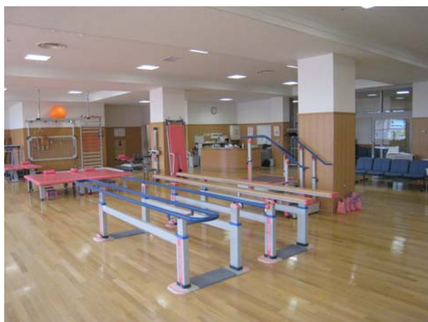
リハビリ室の様子

主な仕事の内容ですが、個々人の障害の状態や能力差によって変わります。関節をやわらかくする運動をする、筋力アップのプログラムを実施する、座位でのバランスを養う、歩行訓練等さまざまな訓練を実施しています。また装具や福祉機器の選択、時には住宅改修のアドバイスなども実施します。最後になりますが、理学療法室の利用者皆さんの今後の生活が、その人にとって素晴らしい生活になるよう応援していきます。