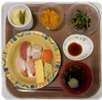
【クリスマス 🎄 お寿司】

行事食は、入居者様の日々の食生活に彩りを添えることを目的としています。 季節感を味わえることで食欲が増進されるだけでなく、コミュニケーションを深める機会にもなります。