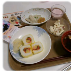
【節分 🍡 太巻き】