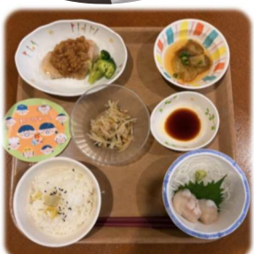
【常呂の日 🐚 ほたてのお刺身】