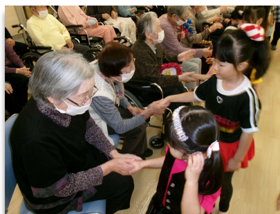
園児とのふれあいもありました！！