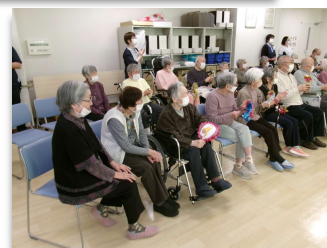
うちわを持って応援！！

12月19日には、ところ認定こども園の園児たちによる、おゆうぎ会を開催して頂きました！園児たちの可愛らしい歌やダンスを見て、皆様大変喜ばれていました！！ところ認定こども園様、ありがとうございました！！