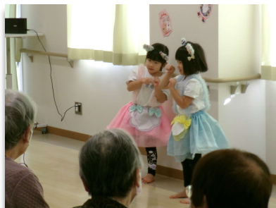
可愛らしい振り付けで、大変盛り上がりました！！