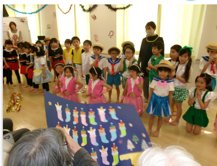
児童からのプレゼントを頂きました！！ 大切に飾らせて頂きます！！